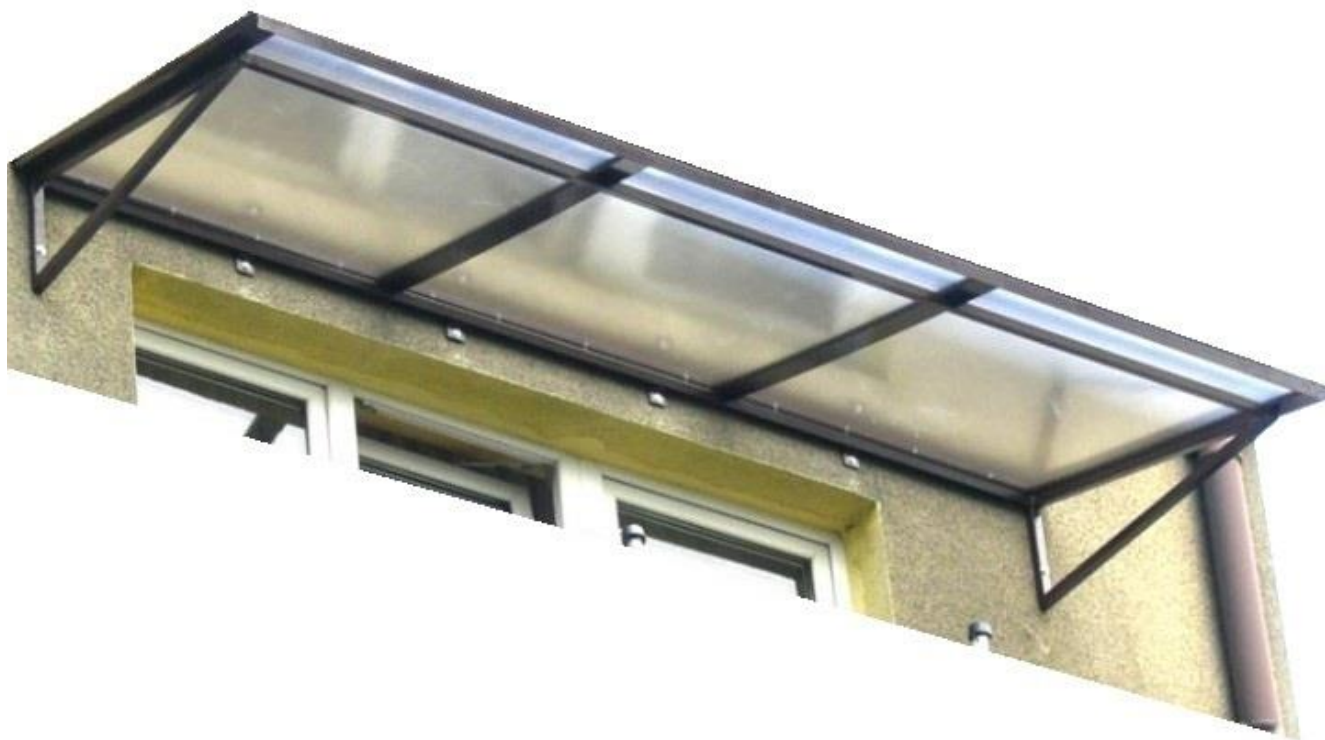
Rys.6 Projektowane zadaszenie – rysunek poglądowy

Modernizacja placu manewrowego w Jednostce Terenowej Wisła, ul.1 Maja 5, TAURON Dystrybucja S.A. Oddział Bielsko-Biała Bielsko-Biała, ul. Batorego 17A